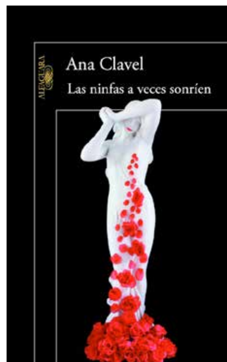
Ana Clavel Las ninfas a veces sonríen México, Alfaguara 2013, 128 pp.