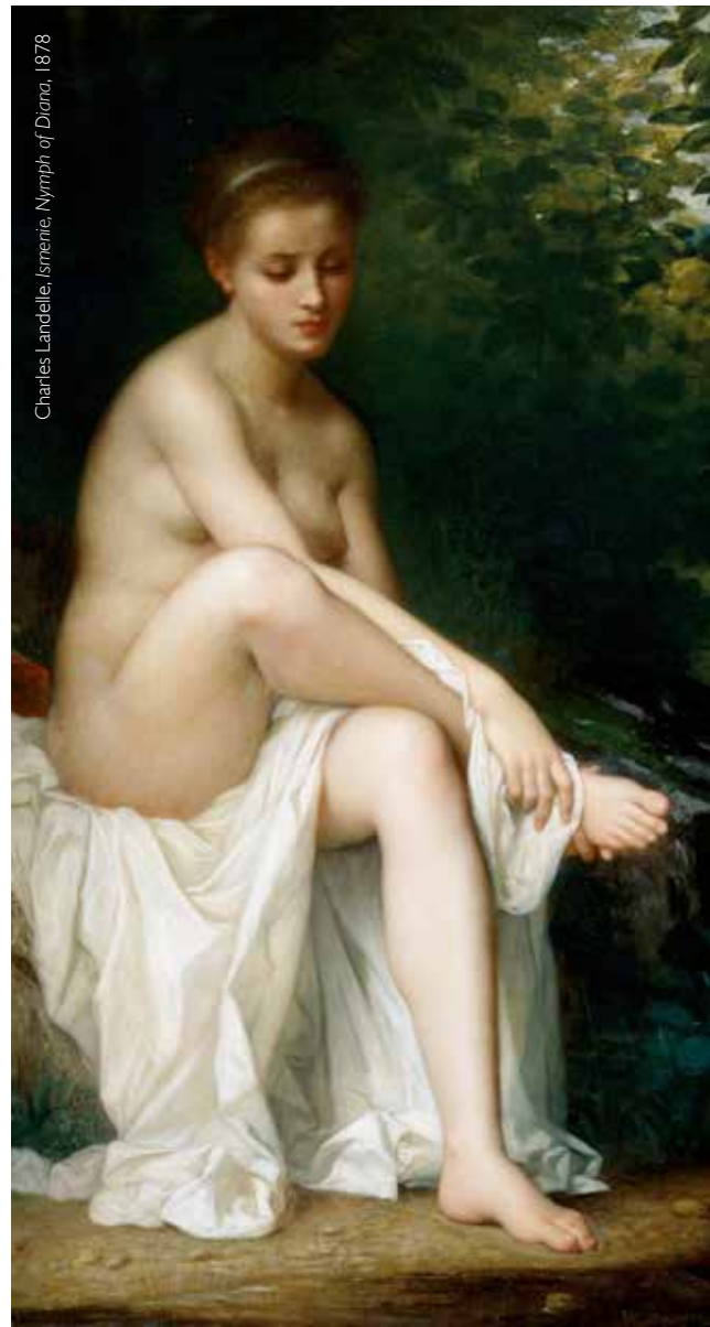
Charles Landelle, Ismenie, Nymph of Diana , 1878

Pareciera que entre las páginas se guarda una palabra aguda y quieta que no tiene género. Es sólo un peculiar estado del ser bajo la noche bíblica, la erótica, la que dio fuerza al verbo para decir, nombrar y empezar un mundo donde la belleza, aquí, no se sienta en las rodillas. Porque en este libro, todo son “sugestivas y exóticas flores del mal”, como dice Ana Clavel. Aquí, en estas líneas escritas por ella, la palabra toca, gime, palpa, vive en cada